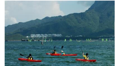
更多市民在吐露港进行水上活动