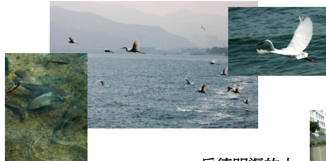
启德明渠的水质也有改善